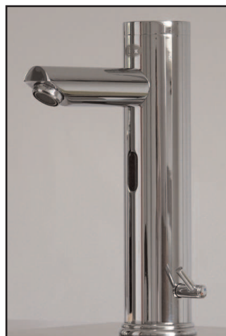
LOex Palau MC2

mit integrierter Mischung für Netz- bzw. Batteriebetrieb