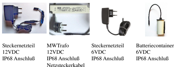
Steckernetzteil 12VDC IP68 Anschluß MWTrafo 12VDC IP68 Anschluß Netzsteckerkabel Steckernetzteil 6VDC IP68 Anschluß Batteriecontainer 6VDC IP68 Anschluß

Wegen unterschiedlicher Wasserqualitäten ist die regelmäßige Überprüfung und Reinigung des Filters empfohlen.