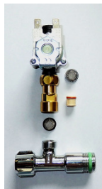
Magnetventil RüVe VS-Adaptor Zugangsfilter Eckventil bauseitig