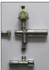
Magnetventil Mischung über DMS-Mischer zur Direktmontage auf Eckventil mit RüVe in KW/WW Eckventil(bauseitig)

Pulverbeschichtung in RAL-Farben und Edelstahlfinish gegen Mehrpreis möglich.