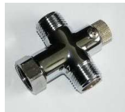
Mischung über Mechan. Vormischer Zb 004 TH H

Mech. Vormischer 1/2" mit Temperaturverstellung mittels fixierbarer Rändelschraube; Messing verchromt, DN 15; RüVe KW/WW, Zugänge u. Abgang in einer Ebene