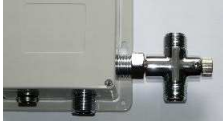
Mischer angeflanscht an Palau Steuerbox