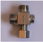
Mischung über T-Stück Zb 023 RI

T-Stück, mit RüVe KW/WW, DN 10, Zugänge u. Abgang in einer Ebene, zur Montage auf Eckventil, 2 Filtereinsätze für Eckventile