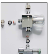
Magnetventil Mischung über DMS-Mischer zur Direktmontage auf Eckventil mit RüVe in KW/WW Eckventil(bauseitig)

Pulverbeschichtung in RAL-Farben und Edelstahlfinish gegen Mehrpreis möglich.