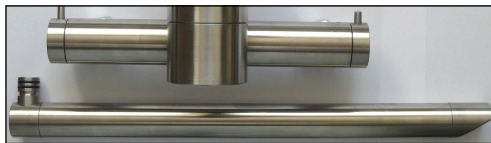
Abb.: Auslauf 300mm